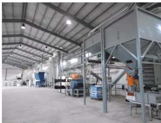
Fàbrica de Pellets en Villahermosa del Río, Castellón. IVACE