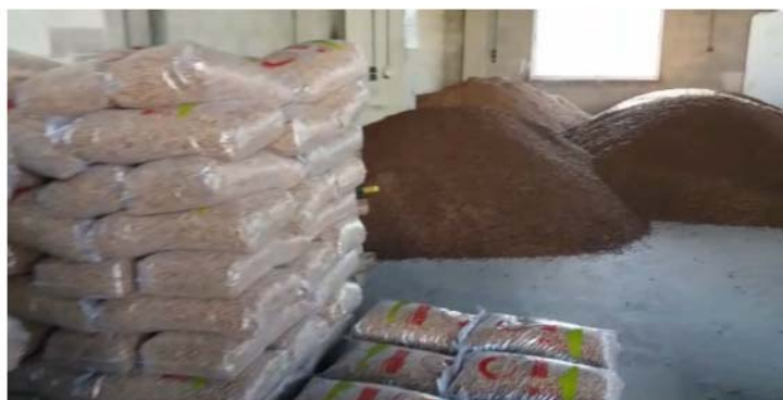
Gestió municipal sostenible de restes de poda. Pelletització. Biomassa. Foment economia local. Casos Serra, Forcall, Cincortres