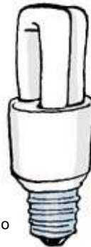
Lámpara de bajo consumo